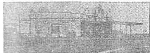
Estación de González Catán, 1911.

Fuente: VIGLIONE, Edgardo E., (2000), "Historia de González Catán", Mayo.