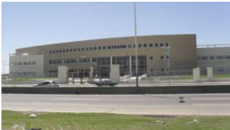
Vista del frente del Hospital