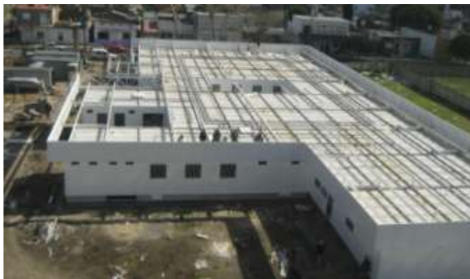
UPA en construcción

A continuación se observan imágenes de esta unidad en construcción en la primer imagen y luego su frente, el día de su inauguración.