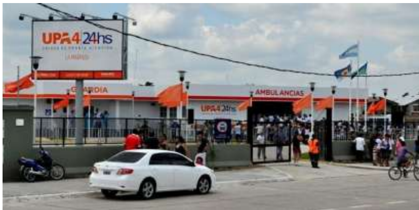
Frente edificio de UPA (22/12/2011)

Fecha de aceptación y versión final: 26 de febrero de 2014