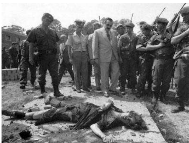
El presidente Alfonsín escoltado por las fuerzas de seguridad, observa el cadáver de uno de los integrantes del MTP. (Regimiento de La Tablada, 1989)

que ellos estaban comandando. Lo que sucedió fue justamente, a la inversa, pues la sociedad salió en repudio de los actos cometidos por los integrantes del movimiento, pues los consideraban como agresores a la estabilidad de la democracia y la paz en la Argentina.