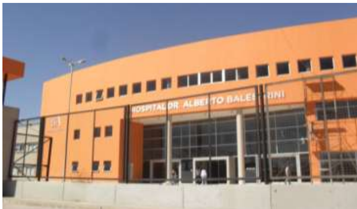
Fachada del Hospital Alberto Balestrini

Fecha de aceptación y versión final: 26 de febrero de 2014