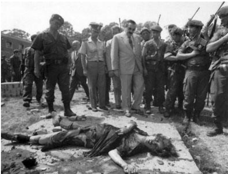
El presidente Alfonsín escoltado por las fuerzas de seguridad, observa el cadáver de uno de los integrantes del MTP. (Regimiento de La Tablada, 1989)

Por otro lado, el Movimiento creía firmemente y estaba convencido de que el pueblo haría eco de su accionar y saldrían a respaldar la acción que ellos estaban comandando. Lo que sucedió fue justamente, a la inversa, pues la sociedad salió en repudio de los actos cometidos por los integrantes del movimiento, pues los consideraban como agresores a la estabilidad de la democracia y la paz en la Argentina.